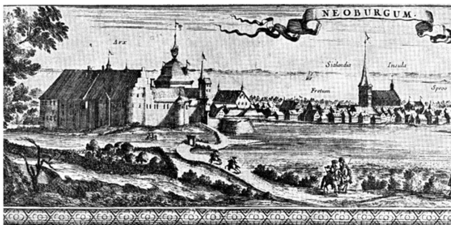
Nyborg Slot med nærmeste omgivelser i 1659.

Denne lærervejledning er udarbejdet med det formål at støtte lærere og elever i Nyborg og Kerteminde Kommuner i forbindelse med deltagelse i jubilæumskonkurrencen om Nyborg som residensby 1525. Vejledningen indeholder inspiration, historiske fakta og praktiske råd, der kan hjælpe med at skabe et unikt kunstværk, som formidler historien om Nyborg som kongens residensstad.