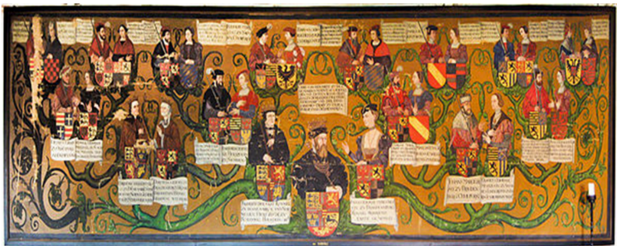
Christian 3.s anetavle på Nyborg Slot.

En anden måde, kongen kunne vise sin magt på, var gennem kunsten. Det var – og er stadig – meget moderne at vise sin magt med flot kunst. Kongen kunne få lavet kalkmalerier af sig selv og sit følge. Her kunne han blive malet i sit fornemste tøj, med flotte våben og dyre heste. Alt sammen for at vise, hvor rig og magtfuld han var.