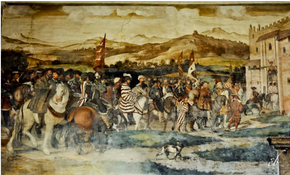
Modtagelsen af Marcello Fogolino.

Derudover fik byen også en ny stærk befæstning (og den flotte gule landport), ny turneringsplads og skibsbro samt en kongelig dyrehave. Alt sammen noget vi kan se den dag i dag.