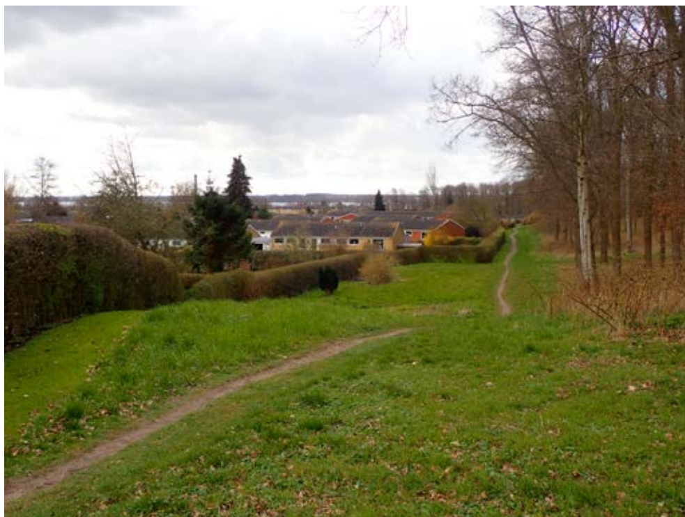
Skovbæltet vest for Højvangen set fra nord mod noret.

på et blad, der er kantet af snart enkelt- og dobbelthuse, snart kædehuse eller rækkehuse. Den nyere bebyggelse af rækkehuse nord for Højvangen og vest for Rosendalen fortsætter den oprindelige bebyggelses logik, mens parcelhuskvarteret øst for Rosendalen trods de ensartede røde tage virker som et brud på den traditionelle havebybebyggelse. Takket være det kollektive ejerskab og de bevarende lokalplaner fra 2008 og 2010 er bebyggelsens karakter stort set intakt bevaret for områderne mellem Lindøalléen og Højvangen.