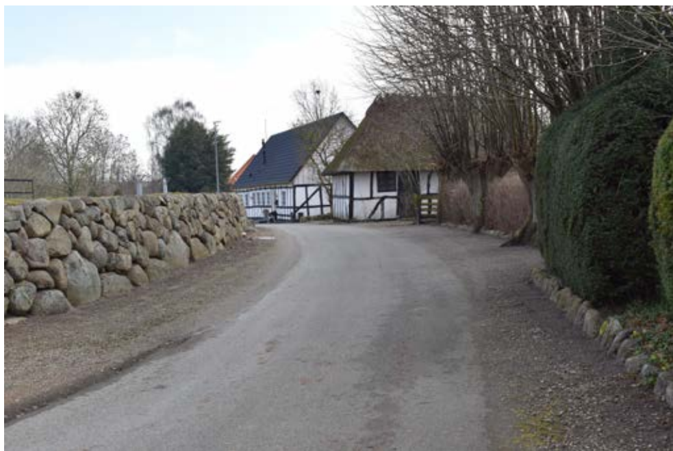
Velbevarede stendiger og bindingsværkshuse i Rønninge. Foto: Østfyns Museer, 2021.

understreges af rækkerne af skulpturelle beskårne platantræer foran bycentret og skole/kulturcentret. Forløbet af allétræer burde dog gøres færdig ved at der også blev plantet på sydsiden fra Troels Allé til Skibskajen.