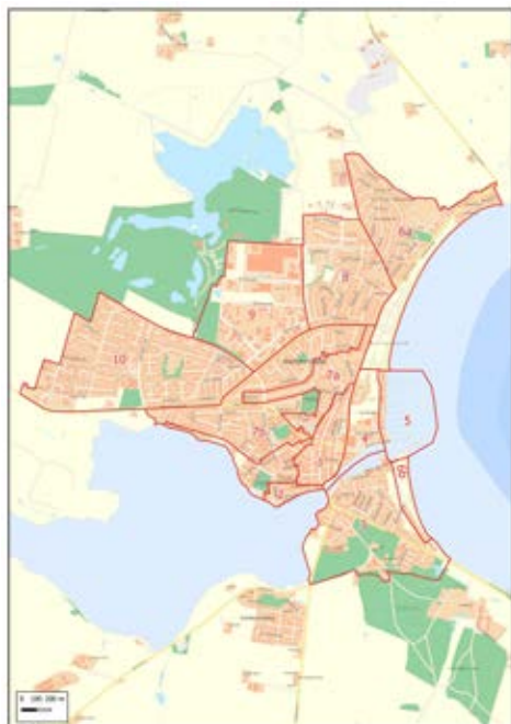
Kulturarvsmasterplanen inddeler Kerteminde i 10 kvarterer efter deres bidrag til den maritime hovedfortælling. Kort tegnet af Roman Varinsky, Kerteminde Kommune.

i kraft af deres placering er umistelige for en helhed. Bygninger med værdierne 5-6 er jævne, pæne bygninger, hvor utilpassede udskiftninger og ombygninger trækker ned i karakteren. Her vil enkle og gennemtænkte udskiftninger eller renoveringsarbejder ofte kunne styrke bygningernes udtryk. Bygninger med værdierne 7-9 er ofte bygninger uden særligt arkitektonisk udtryk eller uden væsentlig historisk betydning.