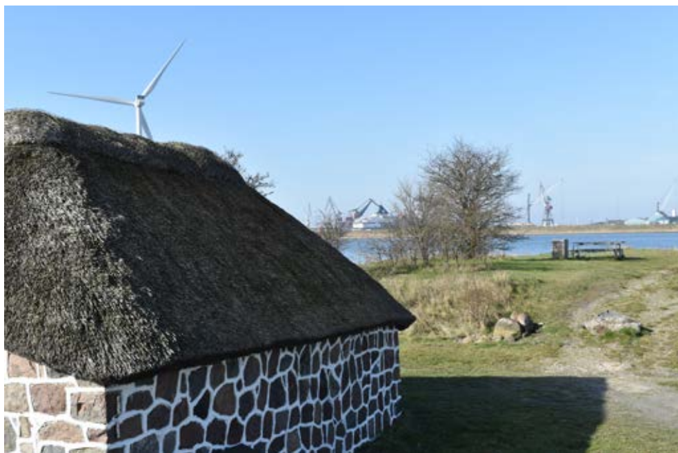
Nyt møder gammelt ved Boels Bro med udsigten fra de gamle kampestenshuse mod Lindøs værftsområde.

af vinduer og døre til en mere stilmæssigt tilpasset udformning. Med i alt 399 huse i kategorierne 2-4 må bevaringstilstanden for husene i købstadens bymidte siges at være overvejende god, men med mange muligheder for forbedringer.