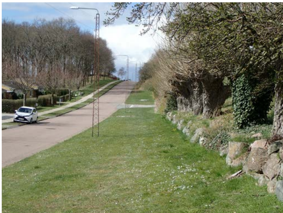
Højvangen med et af de gamle, bevarede pilehegn til højre og et skovbælte til venstre.

I den endelige udformning blev centret opbygget med lave butikker og butiks-rækker i blokke, lagt langs en glasoverdækket gågade – anlagt med små knæk og med udgange mod Lindøalléen og P-pladserne bag centret.