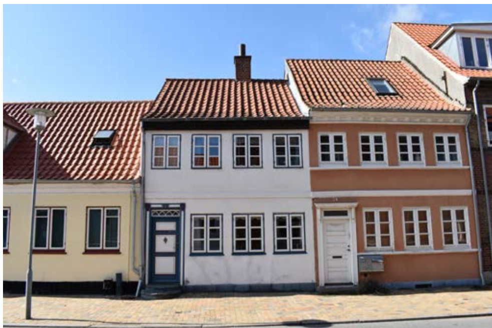
Ét af byens huse, som har fået forholdsvis høj værdi i SAVE-registreringen, er Langegade 77. Med sin fine facaderytme, smukke gadedør og bevarede skorsten har huset opnået en samlet værdi på 3.

blev gennemgået. Derefter drog deltagerne i felten, og alle afkroge af kommunen blev besøgt med notesblok og kamera.