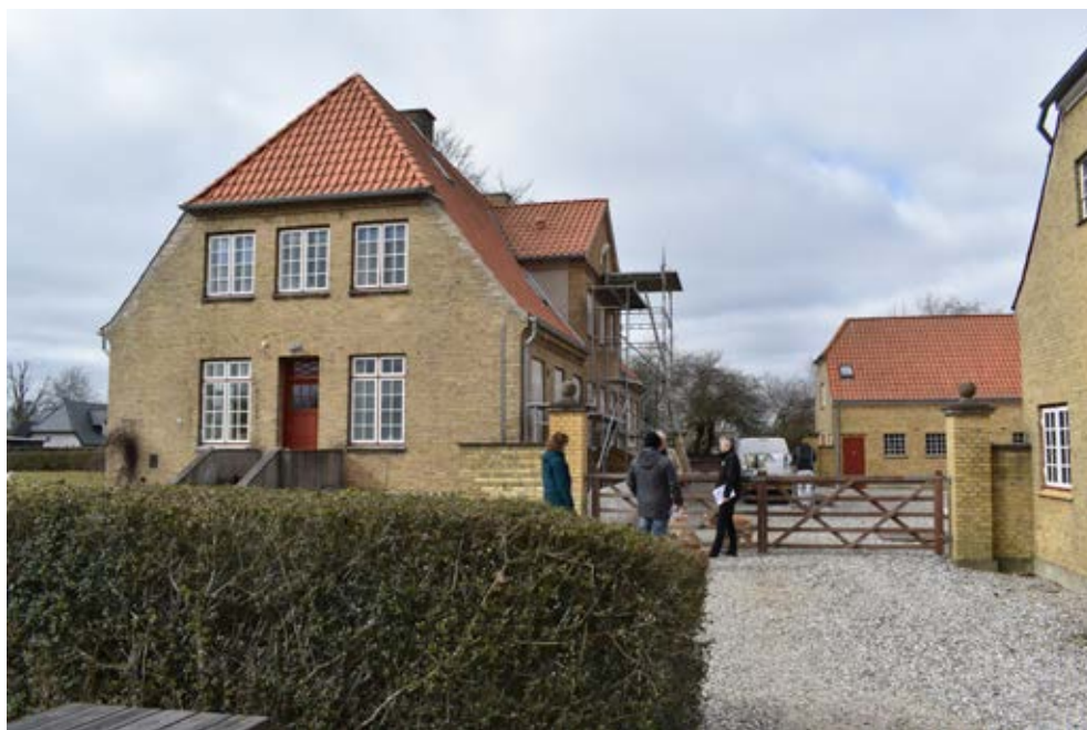
Arbejde i felten. Museets udsendte ses her i samtale med ejeren af den smukke og velbevarede "Stengården" i Dræby.

måde at tilgå kulturarven på, så den bliver et redskab i kommunens fysiske planlægning. Samtidig er det med til at understrege, at kulturarven er en ressource, der indeholder en betydelig oplevelsesværdi. Præsenteret på den rette måde kan den både være med til at gøre de lokale borgere stolte af netop "deres" sted og gøre fremtidige borgere interesseret i at bosætte sig i området.