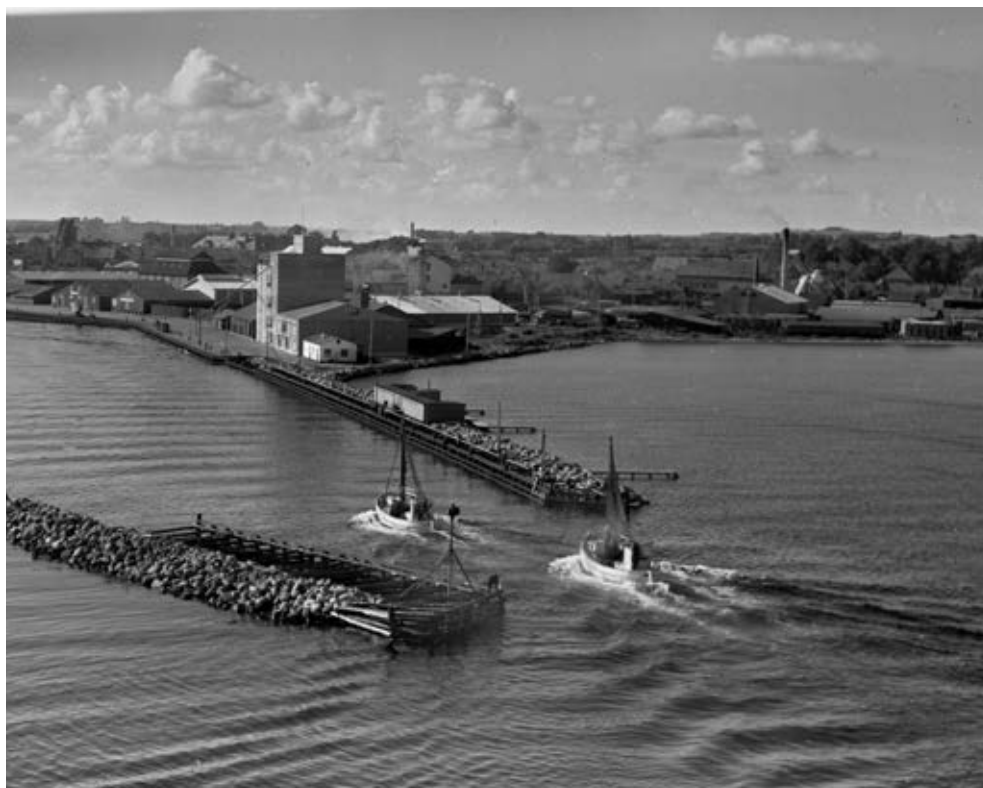
Indsejlingen til Kerteminde Havn i 1950'erne. Området på Nordre Havnekaj har siden bebyggelsen påbegyndtes i de første år af 1900-tallet oplevet gennemgribende ændringer, og ingen af de bygninger, der ses på billedet, eksisterer i dag. Kulturarvsmasterplanen har udstukket retningslinjerne for opførelsen af det boligkvarter, der i disse år pågår.

nyere tid er det motorvejen, der har været afgørende for, at en stor del af kommunens industrivirksomheder er lokaliseret i området omkring Langeskov.